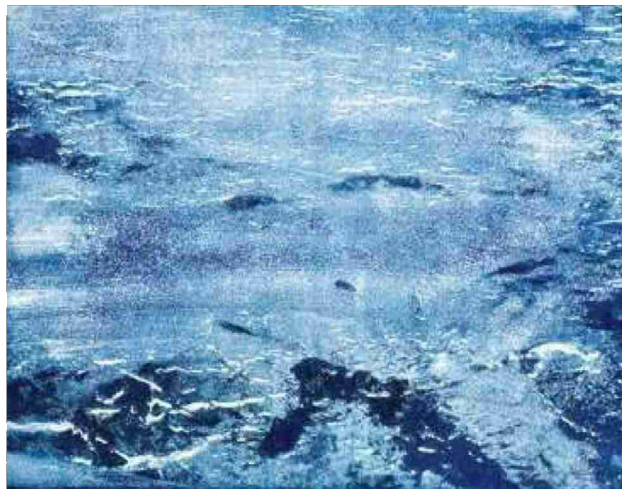
^ Jelena Sredanovic, «Somewhere», 2014. Xylogravure.

N° de thème: 862.020 N° d'abonnement: 862020 Page: 12 Surface: 41'506 mm 2